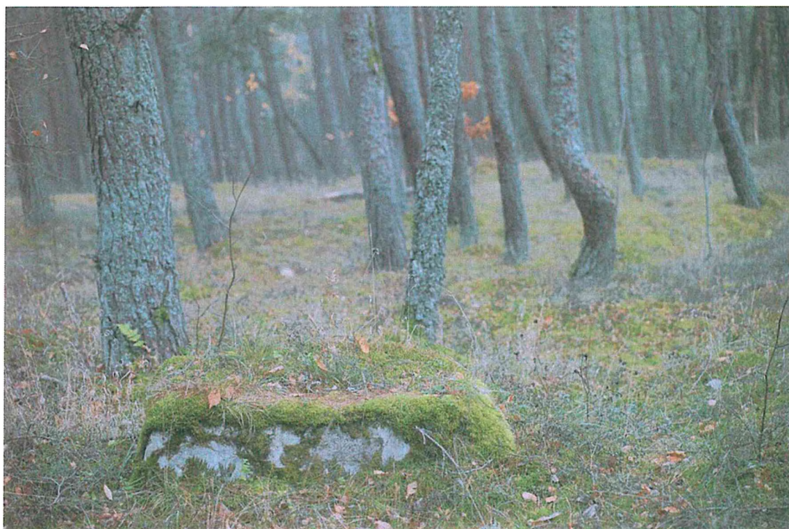
2. Фундаменты немецкой планерной школы