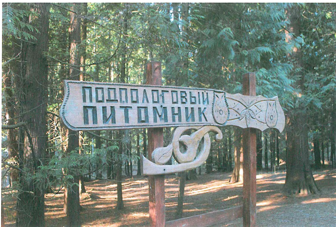
2. Подпологовый питомник туи гигантской